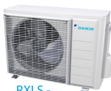
RXLS - Udedel optimeret til drift ned til -25°C