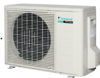
RXS - Standard udedel med garanteret drift ned til -15°C

I komfortfunktion skifter inddelen automatisk vinklen på luftudledningslamellen afhængig af funktion. I køle-drift blæser den opad for at undgå træk, i varmedrift blæser den nedad for at undgå kolde fødder.